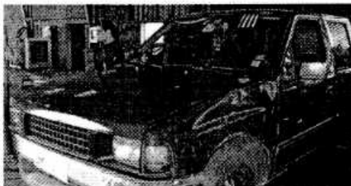
Ilustración 1: Vehículo ensayado

El sistema instalado correspondió a un estanque ubicado detrás del asiento posterior del vehículo, desde el cual bajaba un fluido controlado por una válvula manual, hacia otro estanque inferior, por el cual se hacen pasar los gases de escape del vehículo (ver ilustraciones).