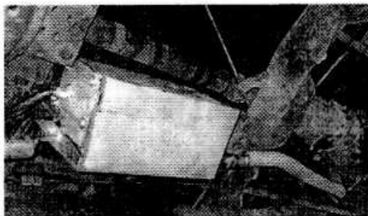
Ilustración 3: Filtro inferior

Según antecedentes del representante, el fluido almacenado es agua con un compuesto denominado Trideful, a una concentración de 10 gr por litro 1 . No se observa marcador de nivel, ni sensores.